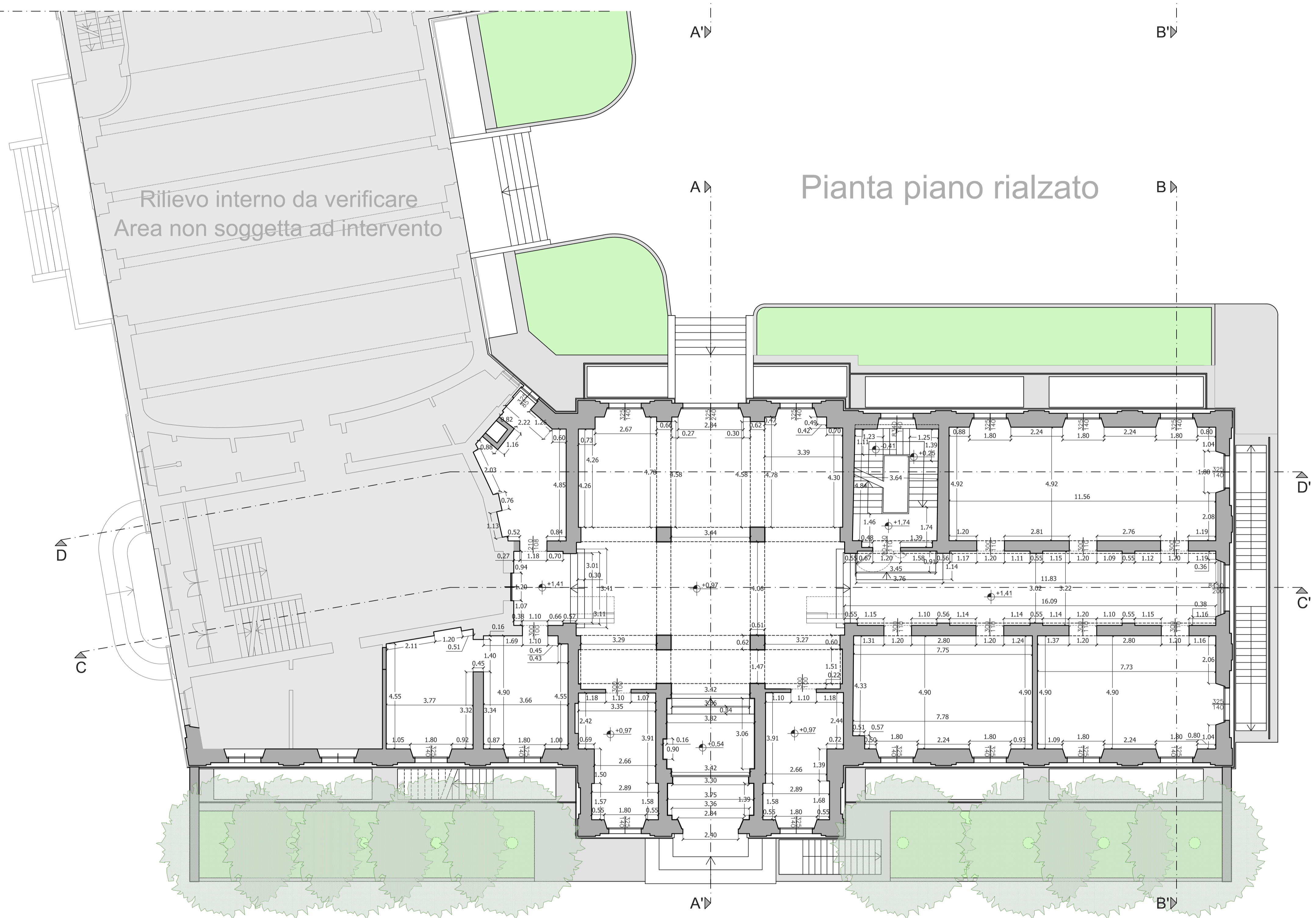
Pianta piano rialzato