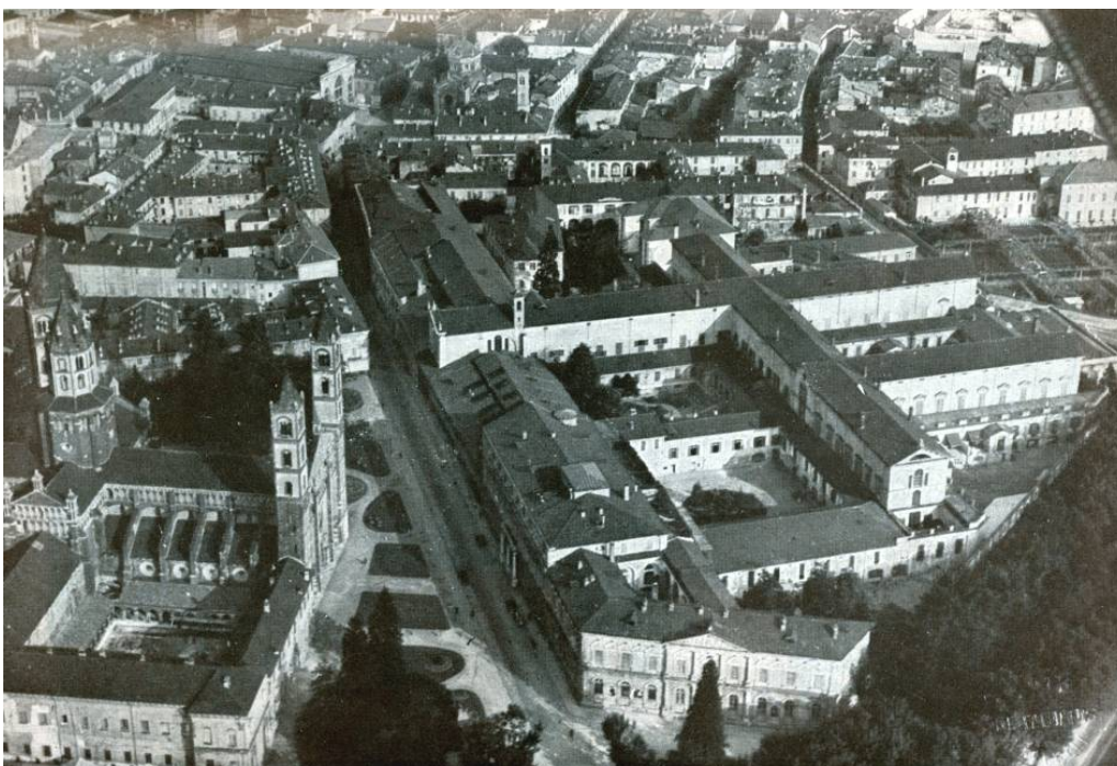
Fig. 1. L'ospedale maggiore nel periodo di massima estensione. Foto aerea alla metà del XX secolo.

L'ospedale di Sant'Andrea fu ulteriormente ampliato nel corso del XIX secolo, evolvendosi attraverso l'aggiunta di fabbricati che si resero via via necessari. Dopo le vicende Napoleoniche, alla metà del 1800, l'Opera Pia si trasformò in vera e propria istituzione terapeutica; negli stessi anni viene realizzato un importante ampliamento, riproponendo la tipologia delle maniche porticate destinate alle diverse funzioni ospedaliere.