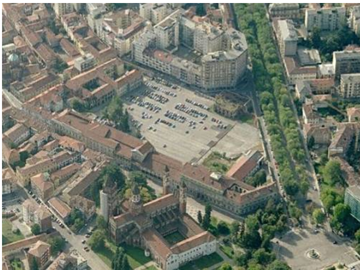
Fig. 3. Veduta aerea dell'intero comparto. 2011

Nel 1960 a seguito della costruzione del nuovo Ospedale Maggiore della città di Vercelli la struttura del Sant'Andrea viene dismessa: il comparto fu oggetto di pesanti demolizioni che hanno interessato alcuni padiglioni dell'ospedale, lasciando un'ampia area libera al centro dell'isolato e verso corso Garibaldi che comporta un senso di frammentazione all'interno del tessuto urbano. Per quanto riguarda gli edifici rimasti, gran parte di essi versano oggi in stato di abbandono e di diffuso degrado edilizio, mentre l'area libera interna è utilizzata a parcheggio non organizzato, accrescendo il senso di disordine generale. L'intervento rappresenta pertanto una opportunità per la città per riqualificare e vivacizzare questo importante quadrante urbano.