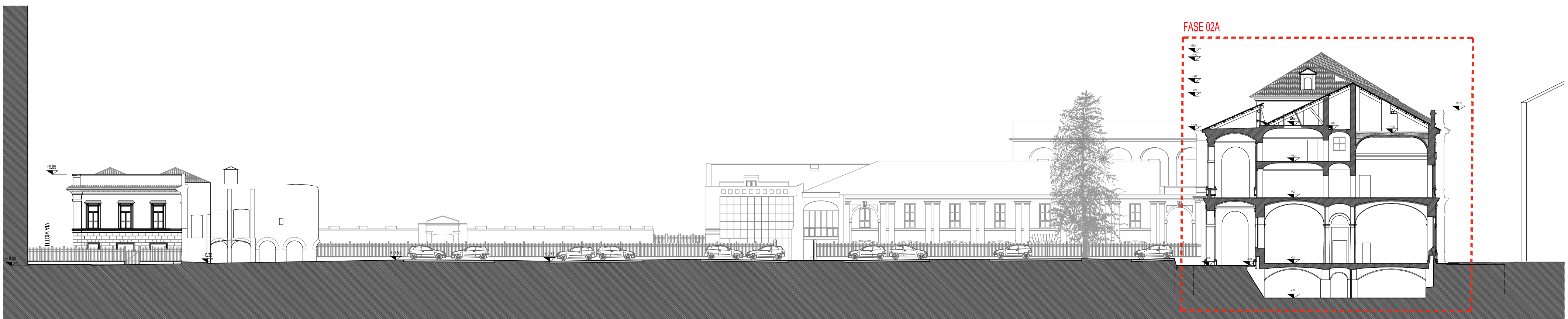
SEZIONE TRASVERSALE GENERALE AA scala 1/300