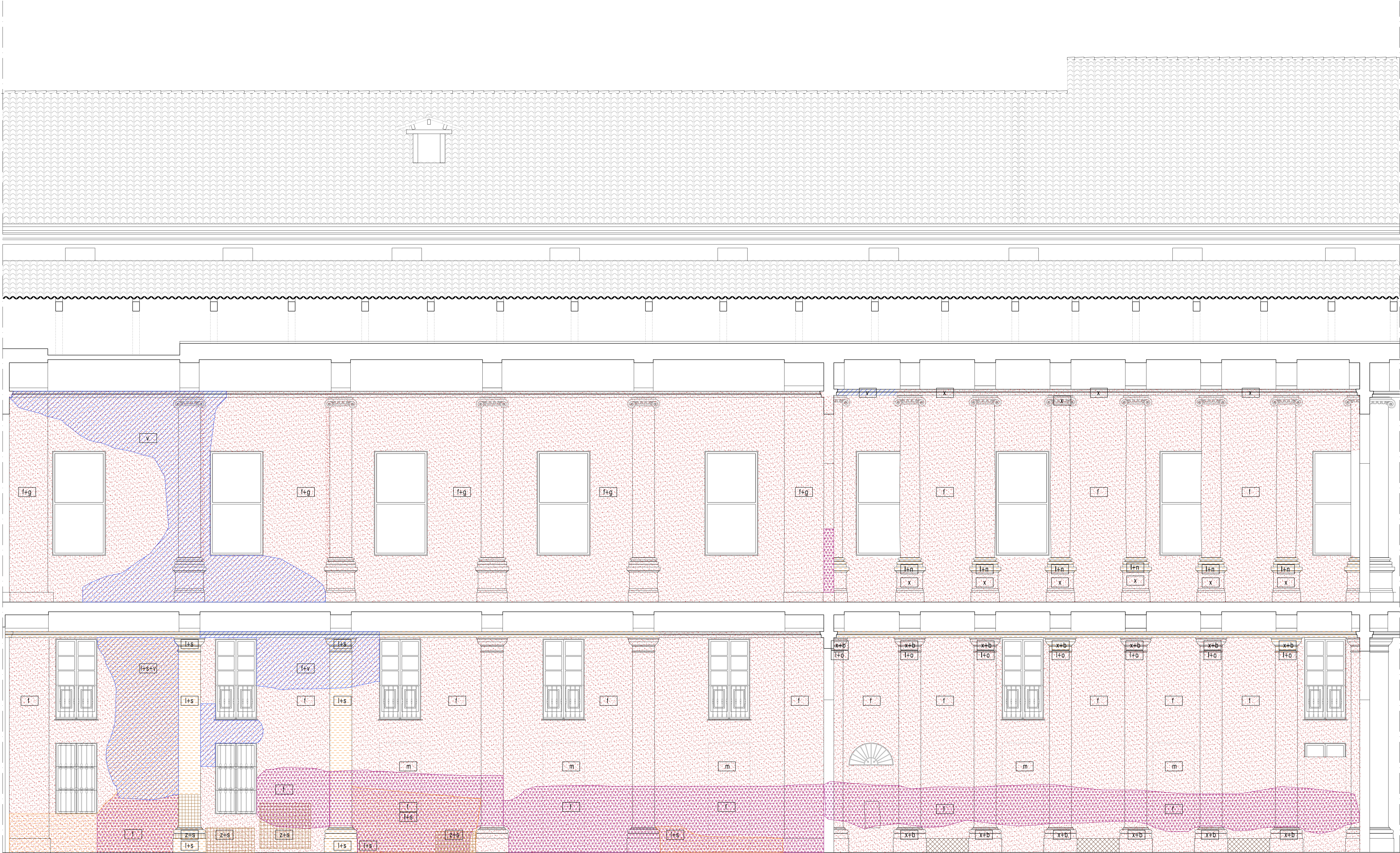
PROSPETTO 03 - FRONTE PORTICATO COMPARTI F-G