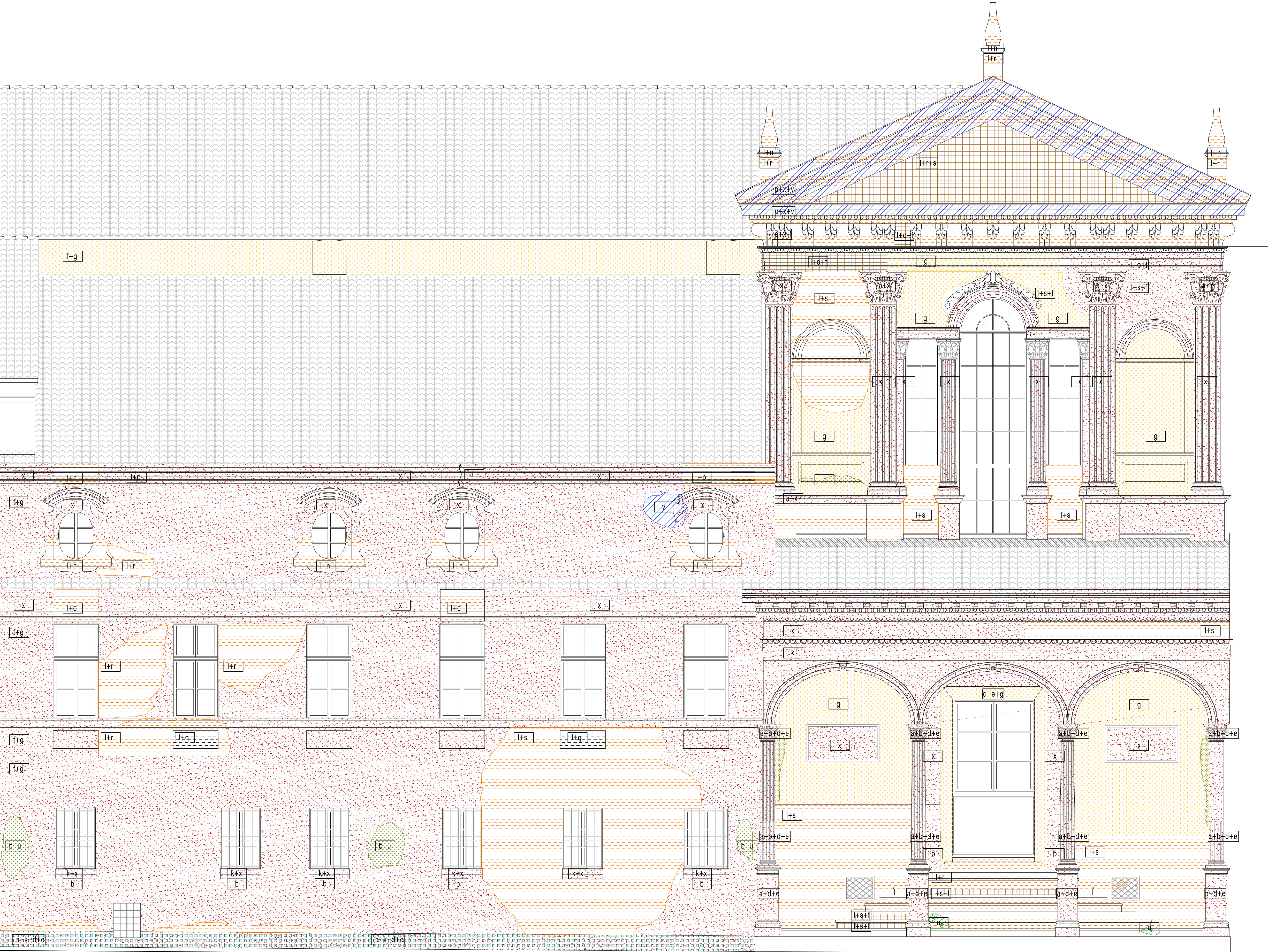
PROSPETTO 01 - VIA FERRARIS COMPARTI D-E