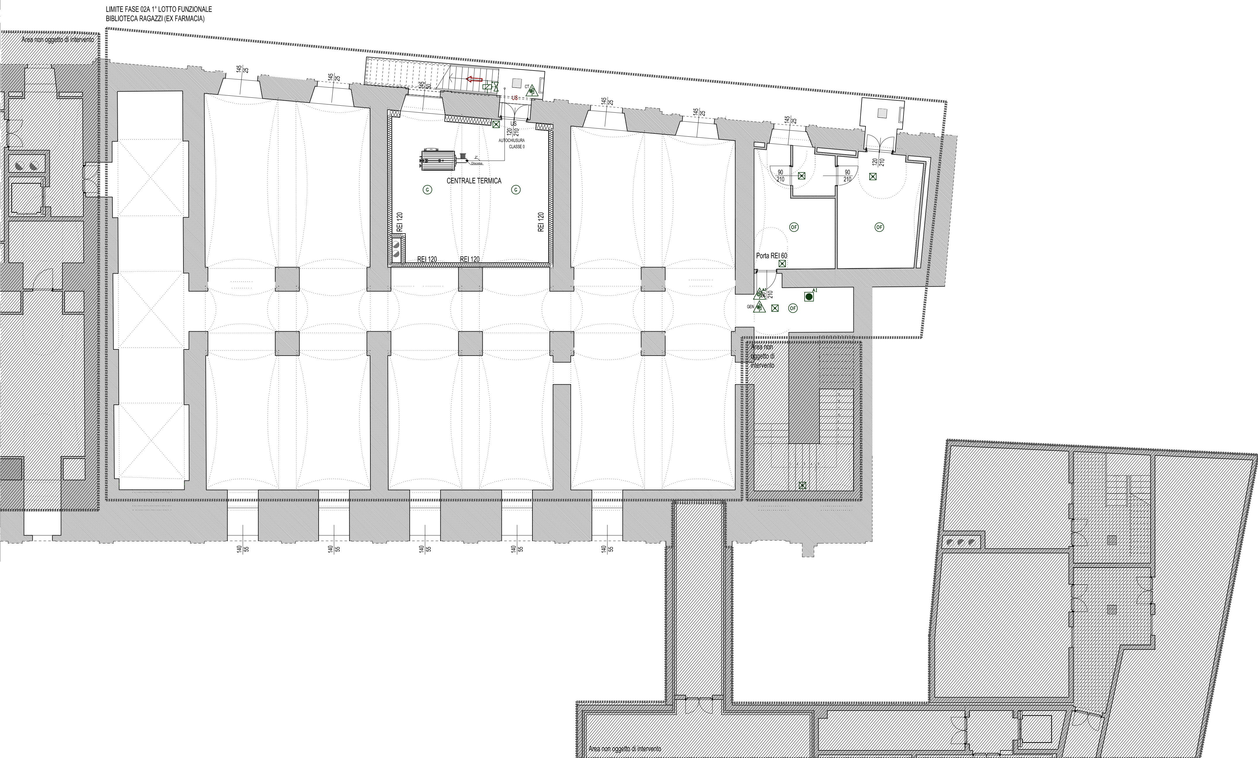
PIANO INTERRATO [- 4.00]