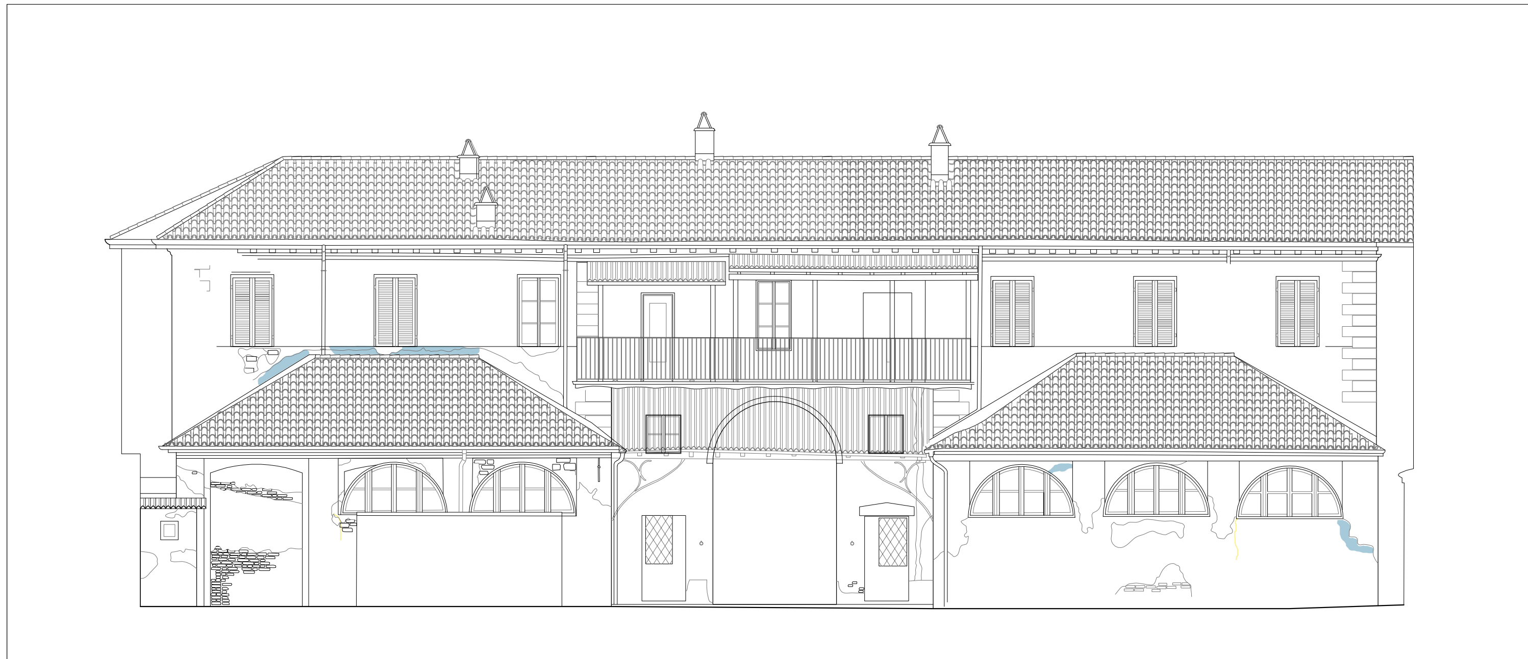
FESSURAZIONE - DISTACCO INTONACO