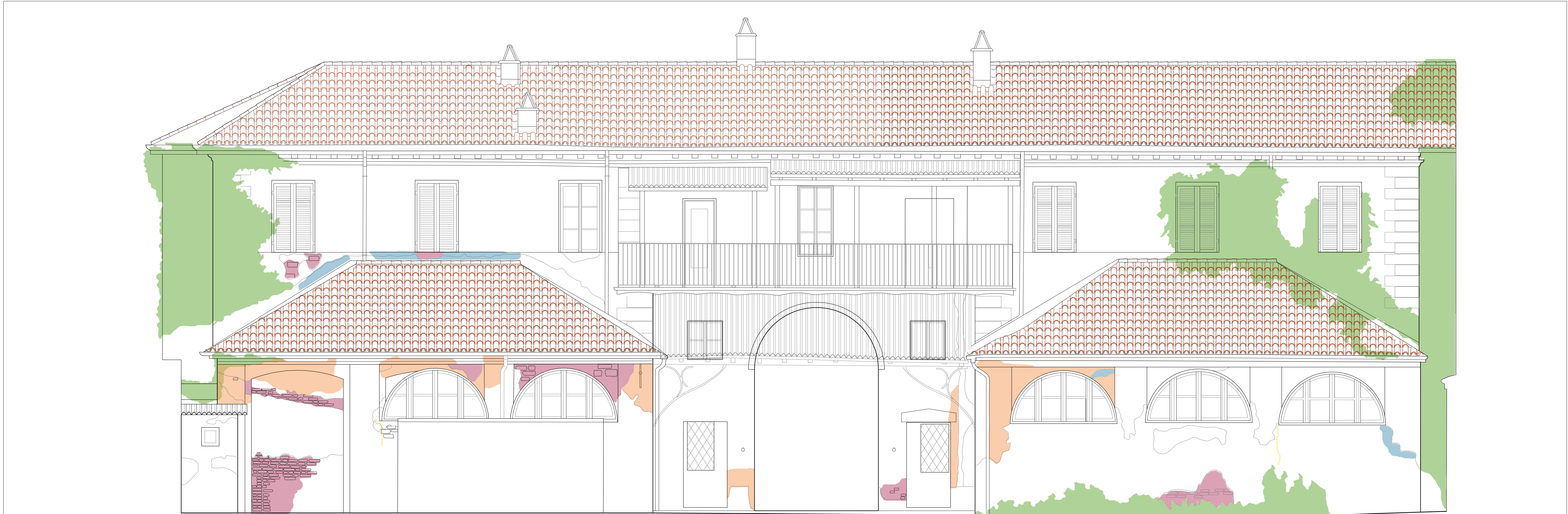
STATO COMPLESSIVO DI DEGRADO