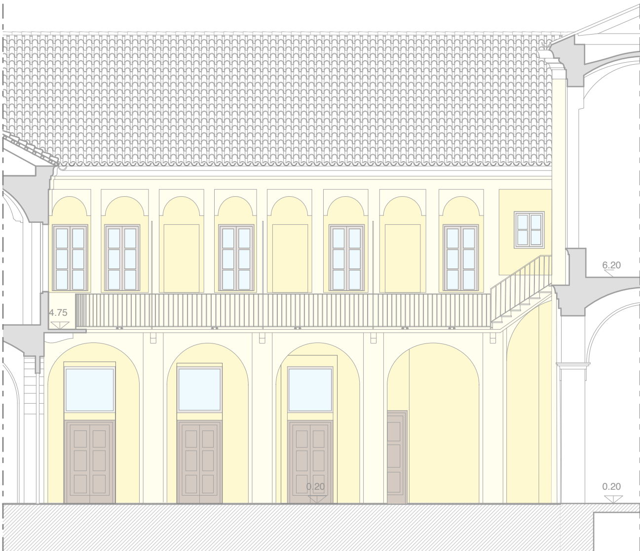
prospetto cortile nord-est