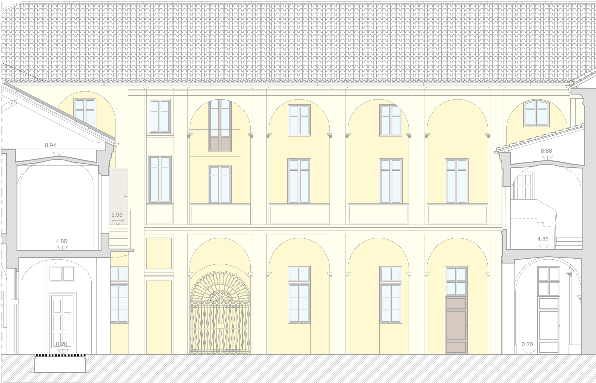
prospetto cortile sud-est