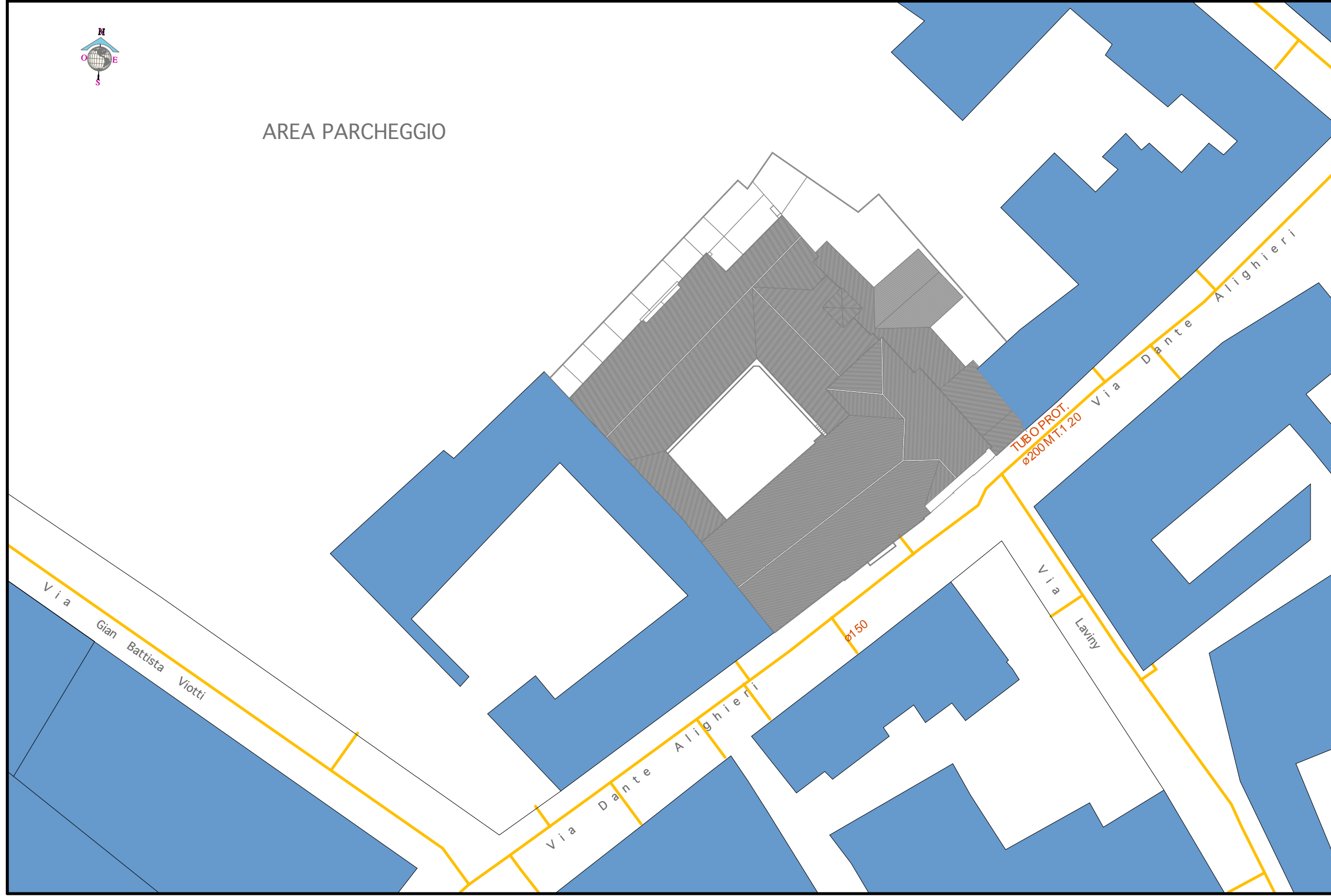
PLANIMETRIA ALLACCIO ALLA RETE DEL GAS CITTADINA R1/500