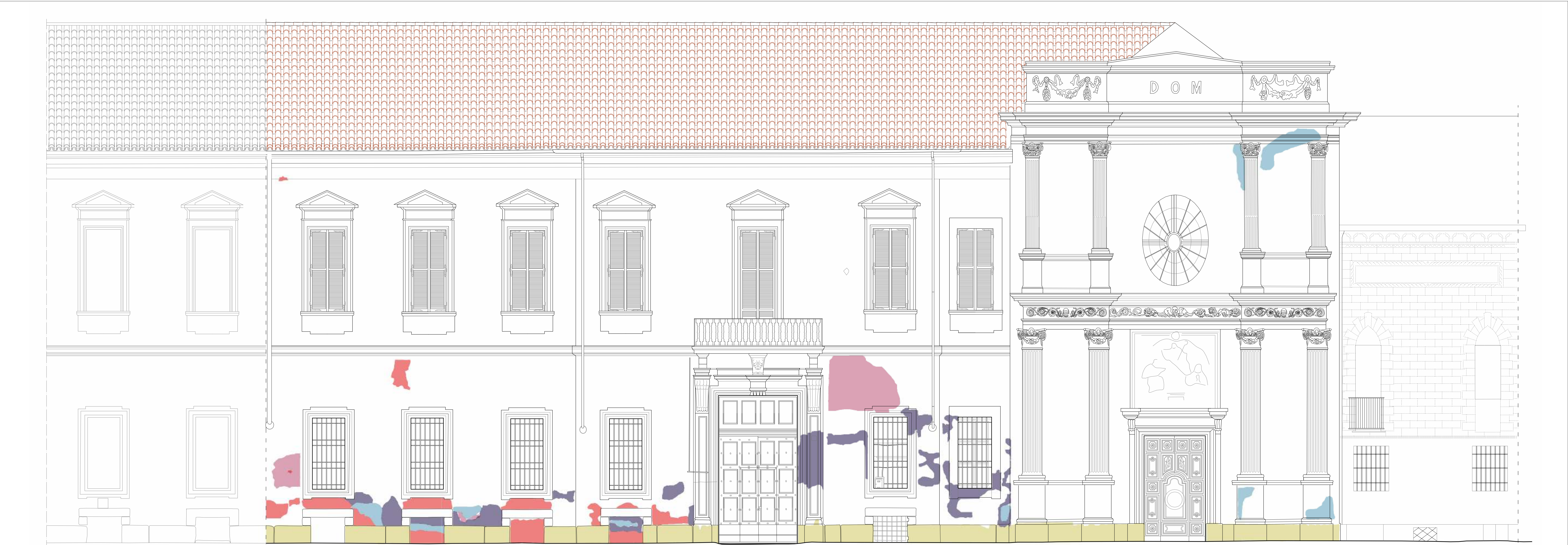
STATO COMPLESSIVO DI DEGRADO