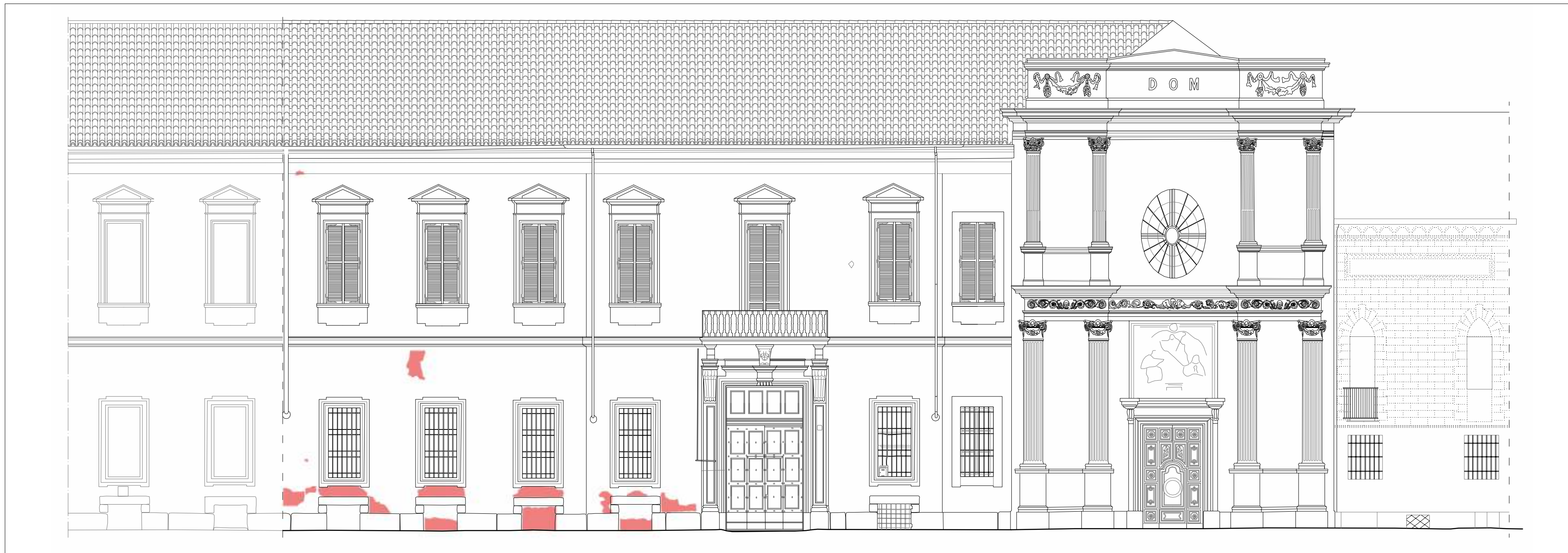
CADUTA del COLORE