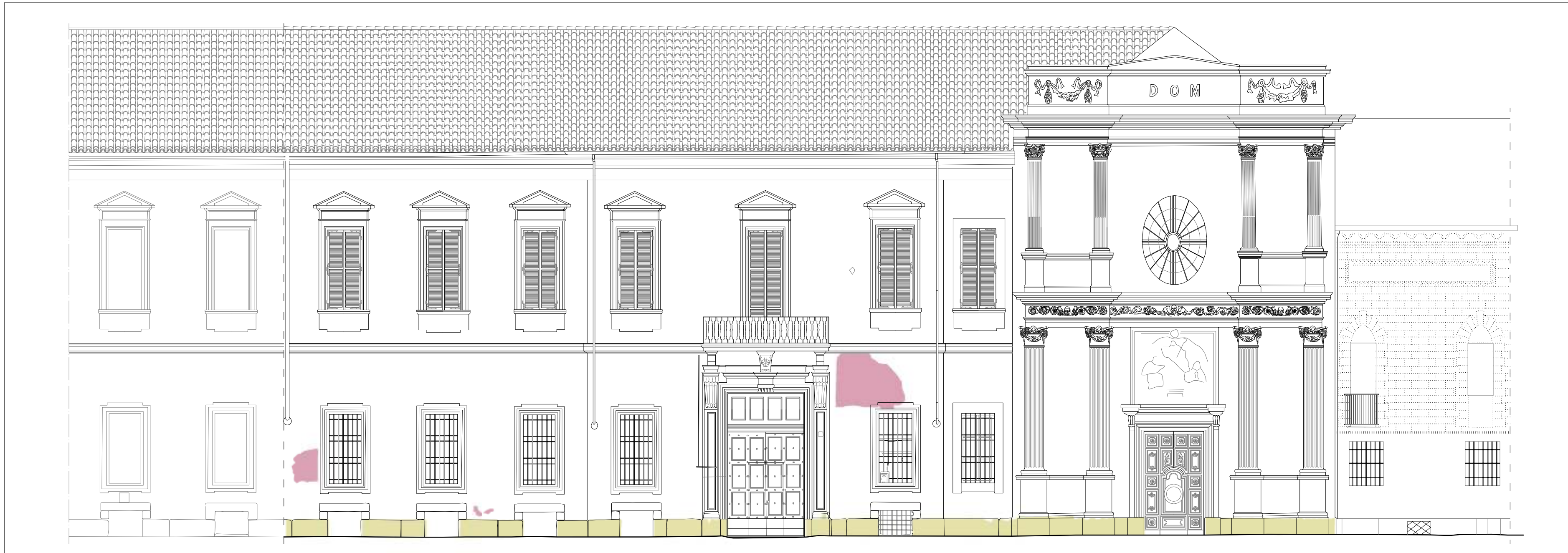
SFALDAMENTO della PIETRA e CADUTA INTONACO