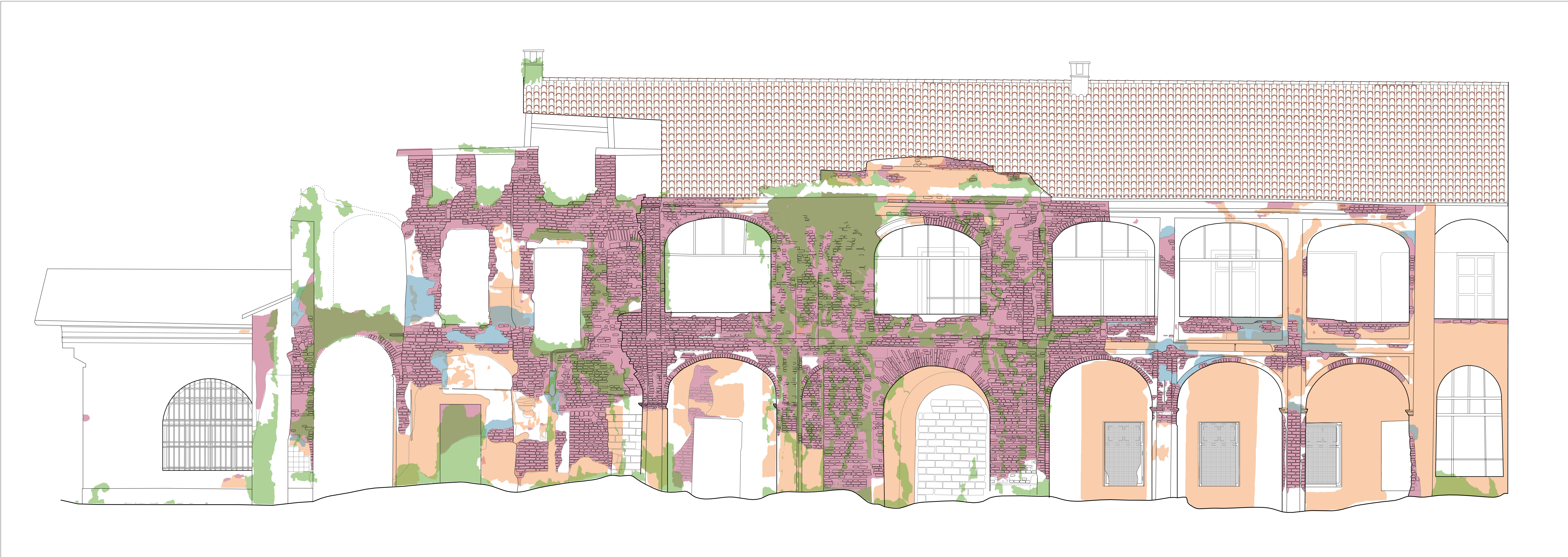
STATO COMPLESSIVO DI DEGRADO