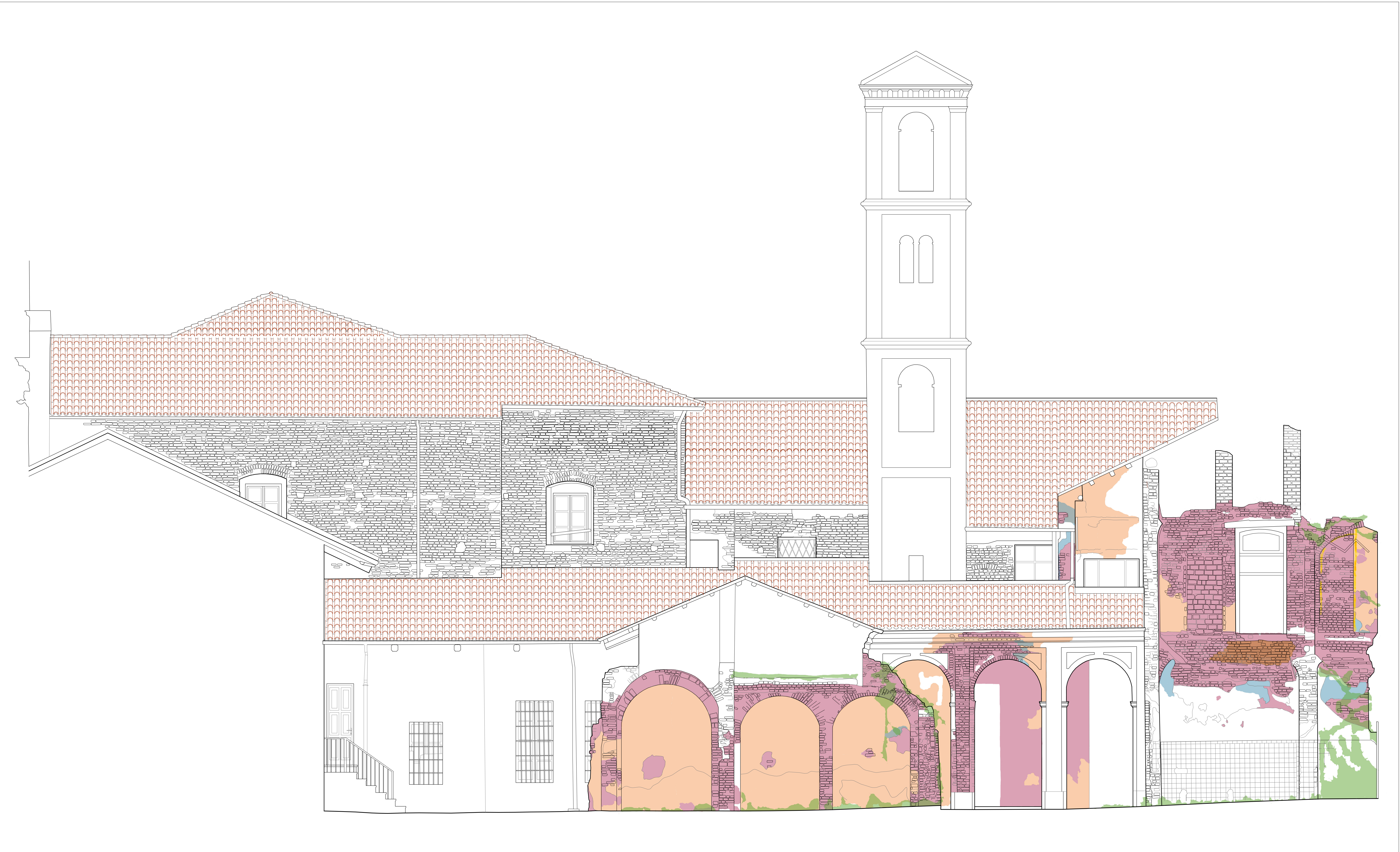
STATO COMPLESSIVO DI DEGRADO Scala 1:50