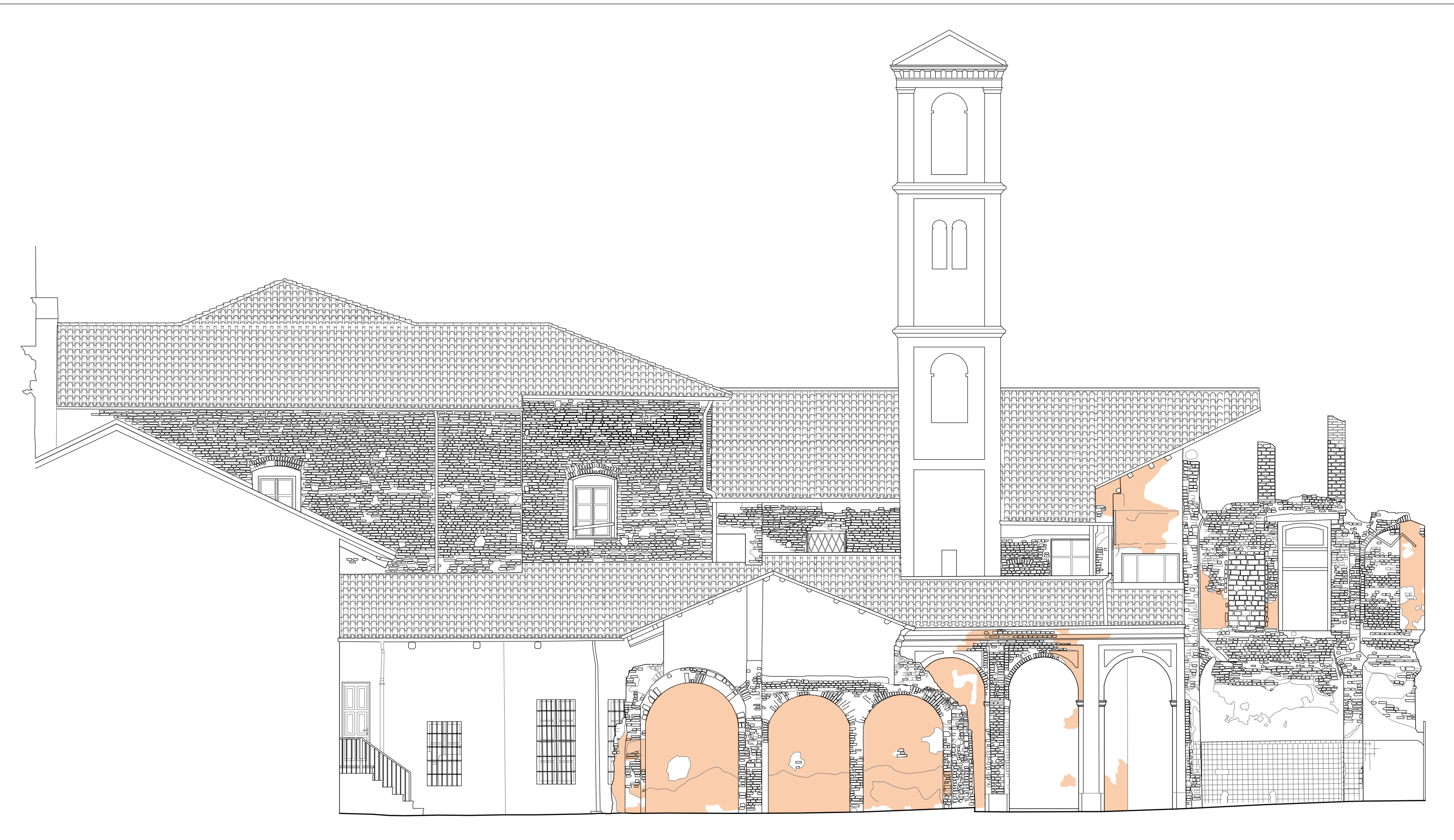
ABRASIONE INTONACO Scala 1:100