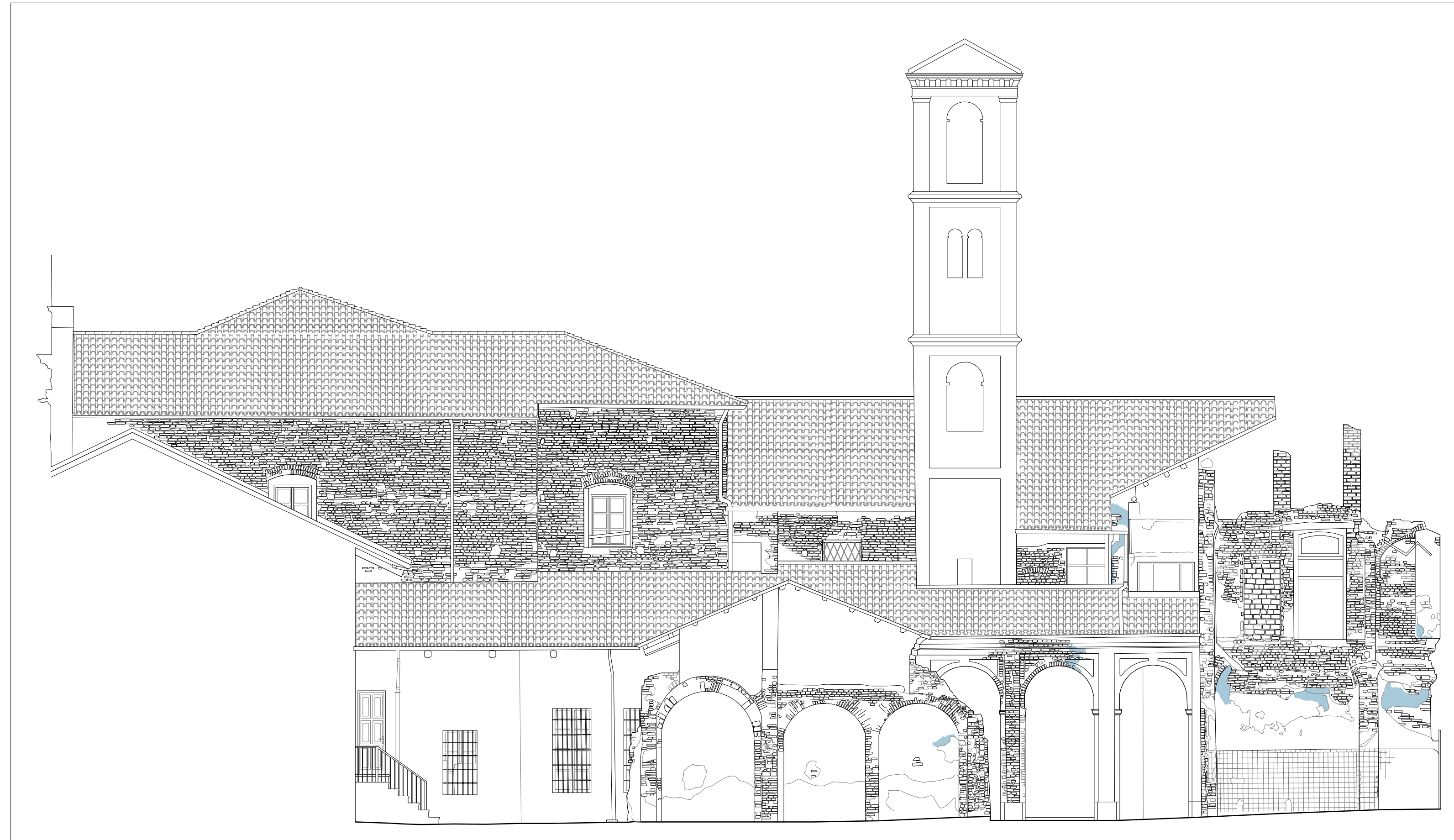
DISTACCO INTONACO Scala 1:100