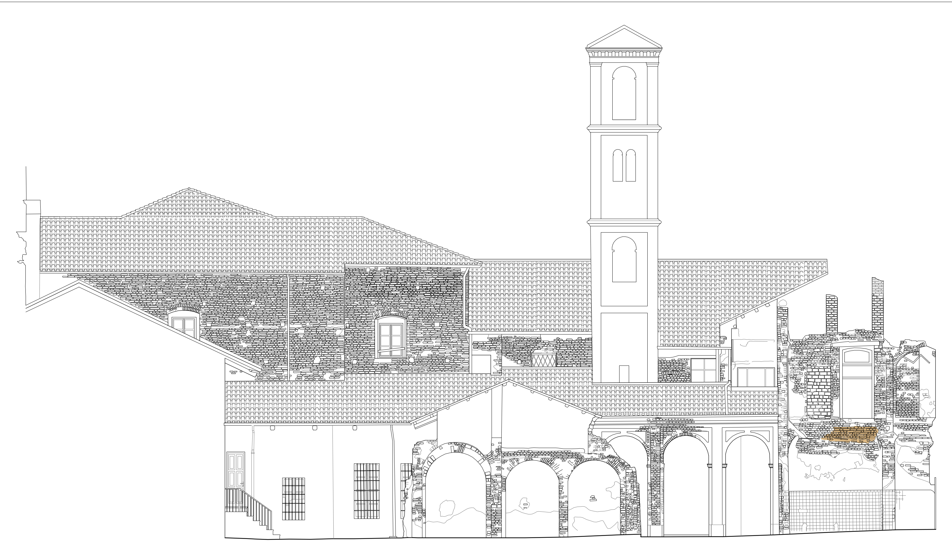
CORROSIONE DEL GIUNTO Scala 1:100