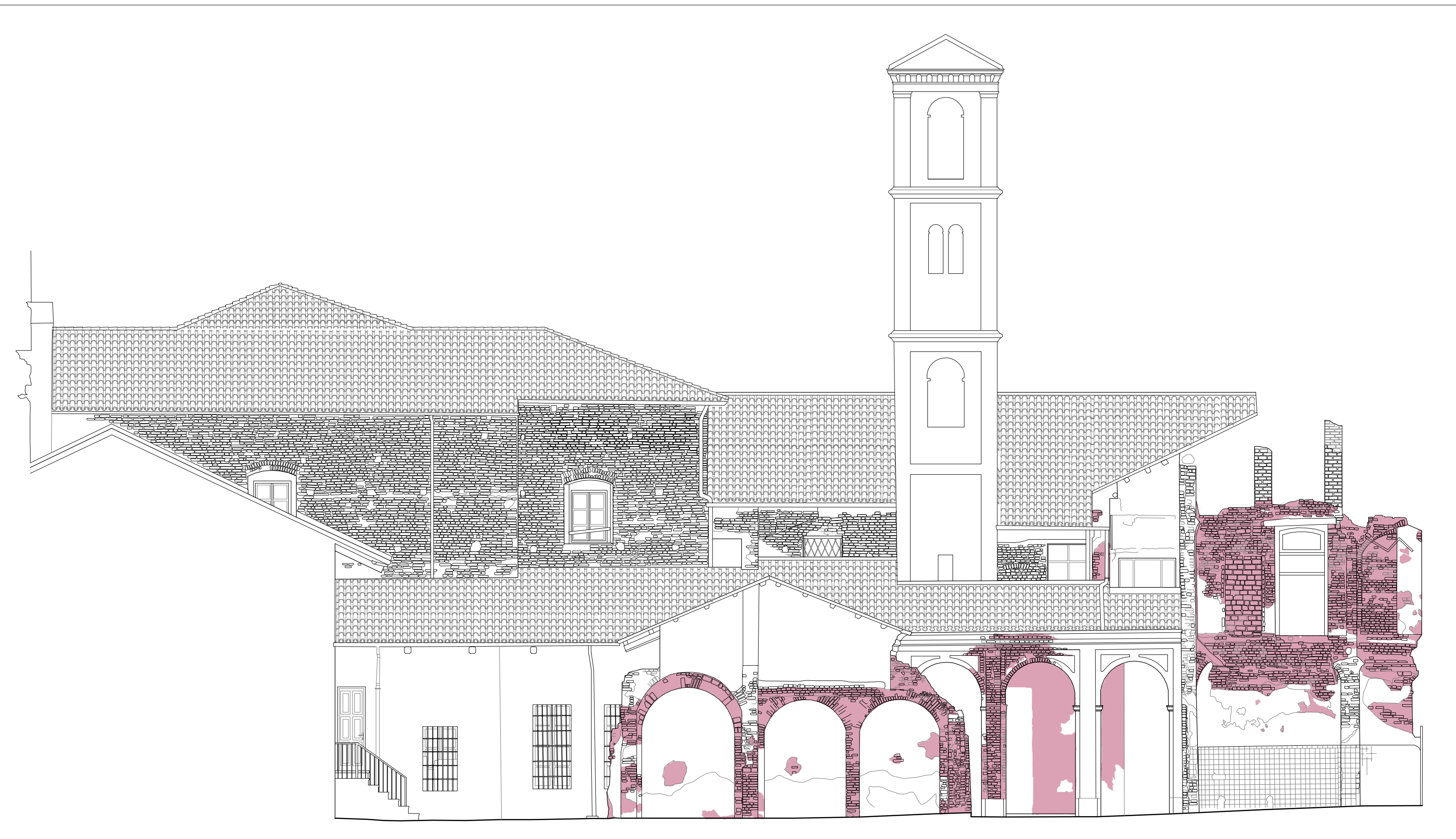
CADUTA INTONACO Scala 1:100