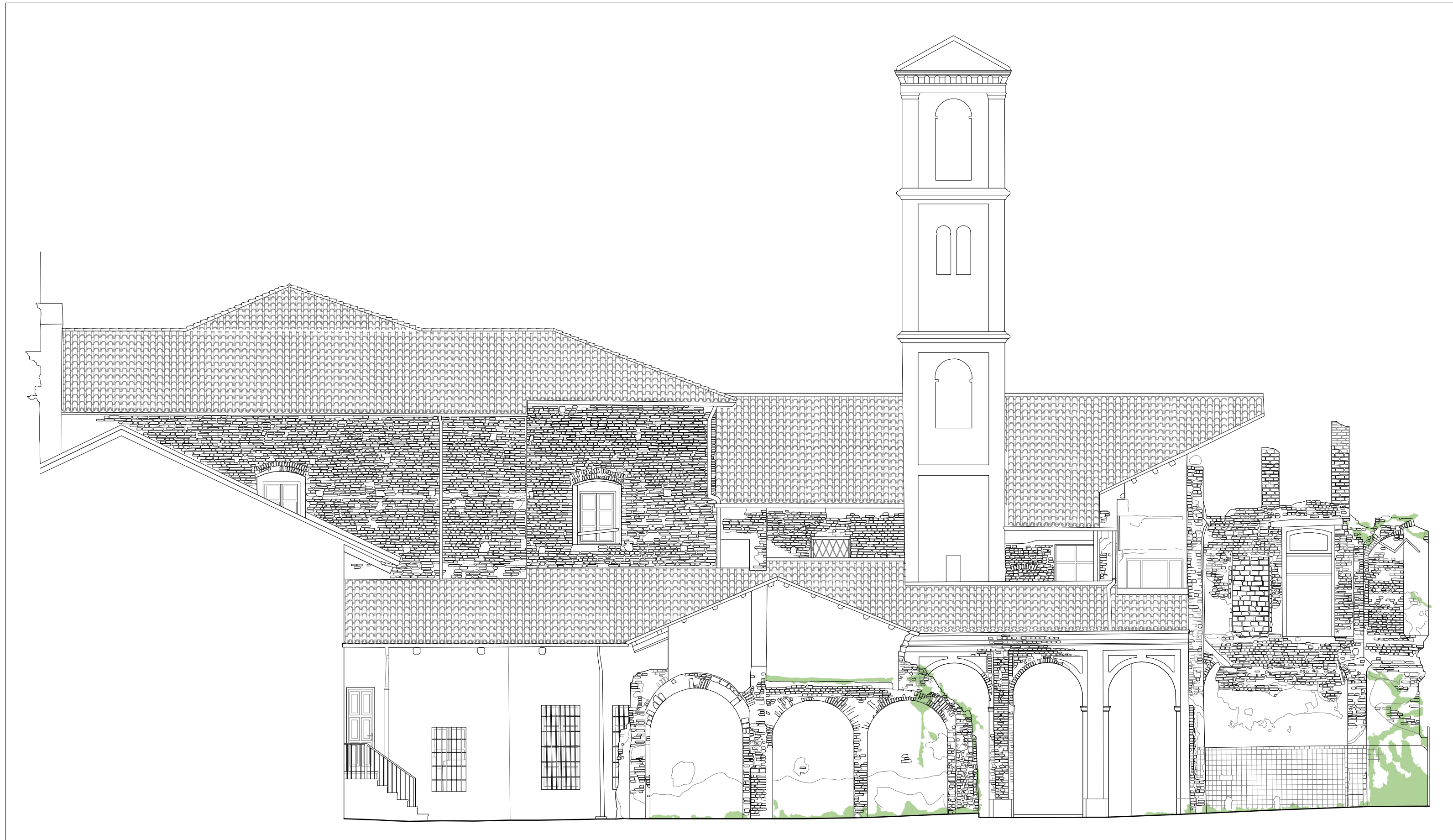
VEGETAZIONE Scala 1:100