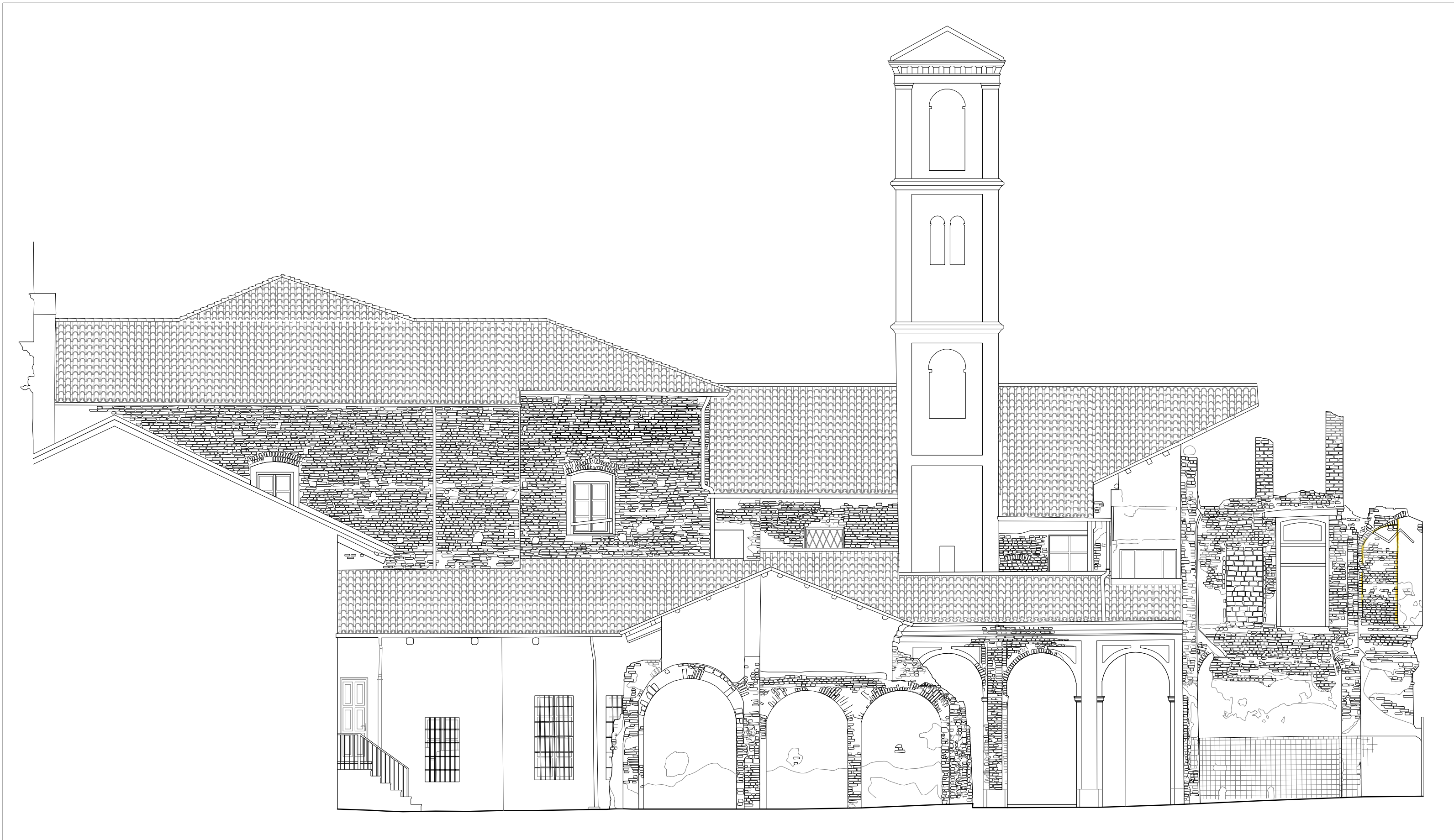
FESSURAZIONI Scala 1:100