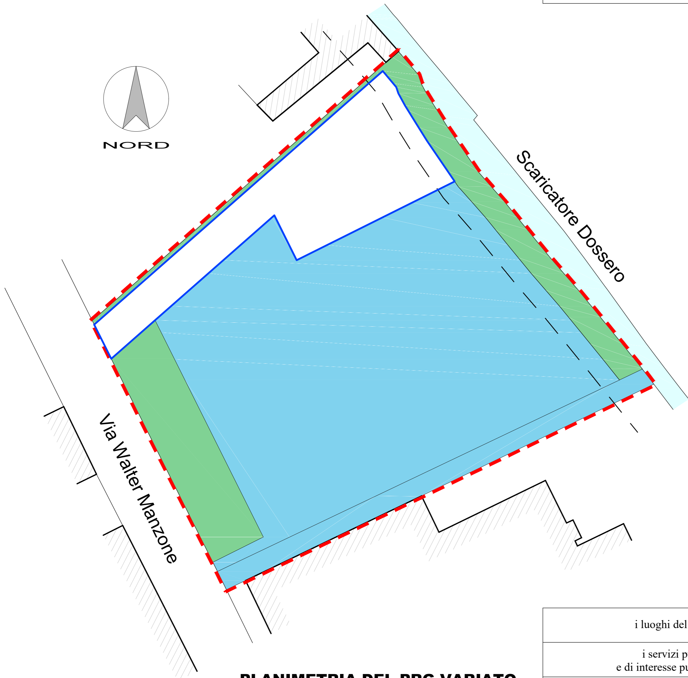
PLANIMETRIA DEL PRG VARIATO (SCALA 1:500)