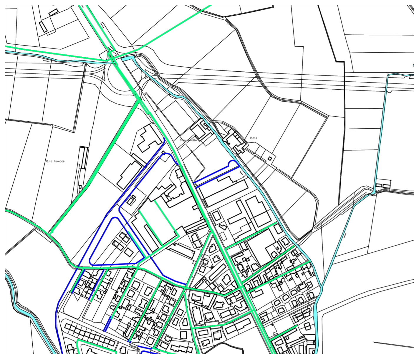
tav.6.1.2 rete GAS