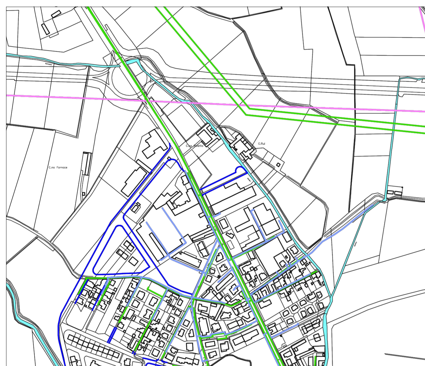
tav.6.2.2 rete energia elettrica