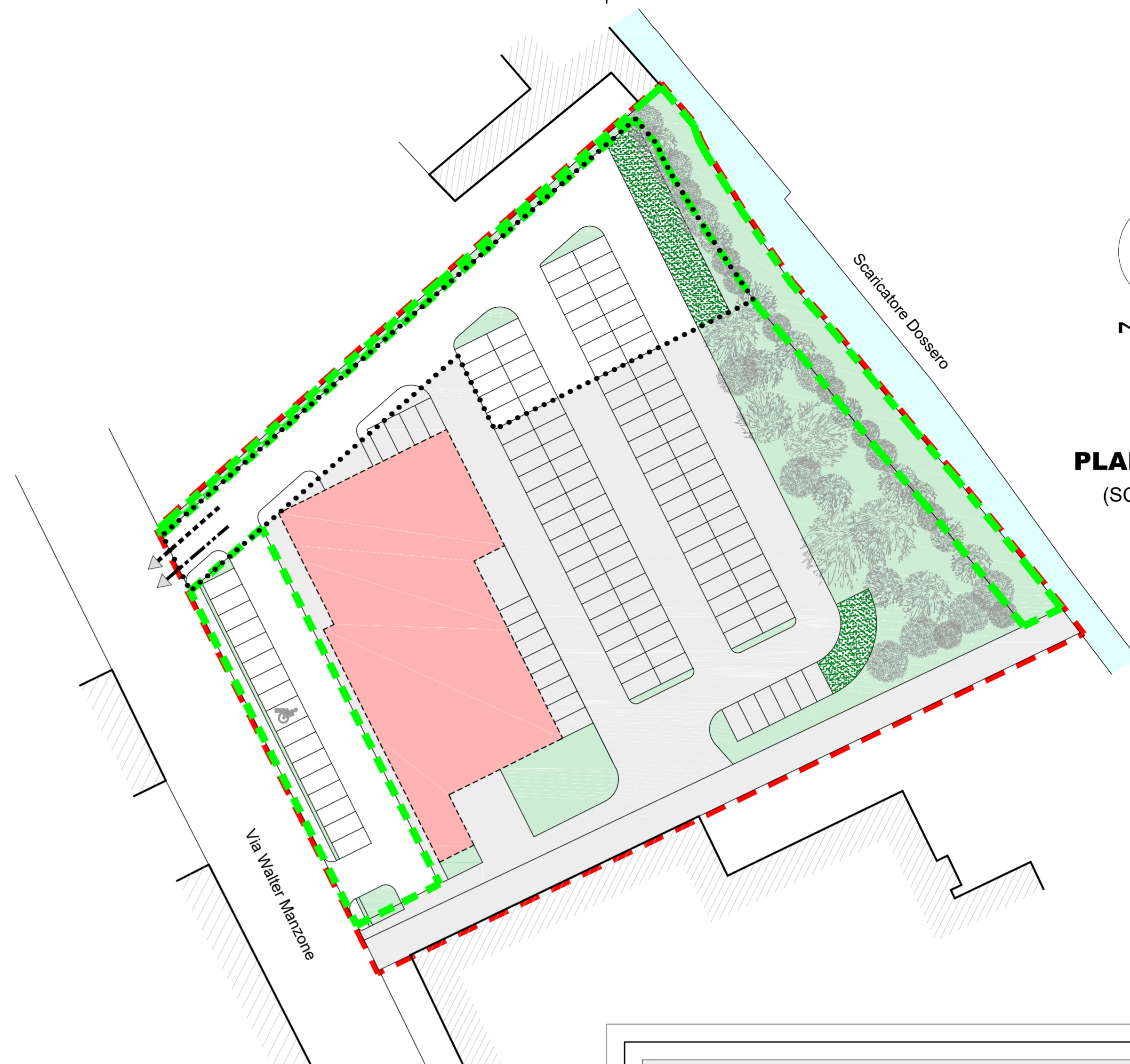
PLANIMETRIA (SCALA 1:500)