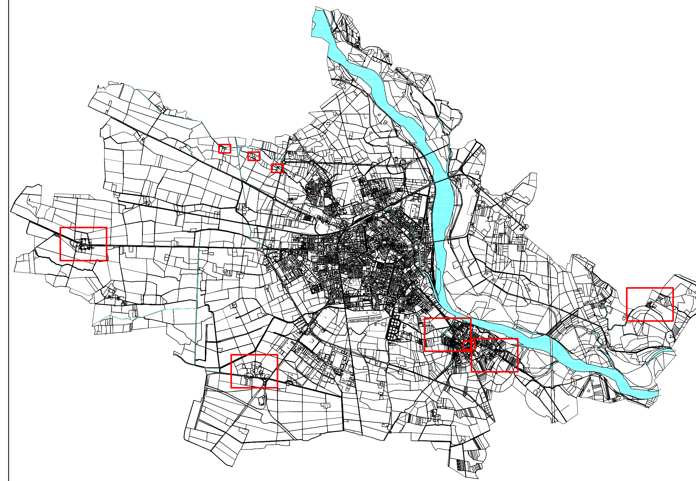
Carta d'insieme - scala 1:50.000