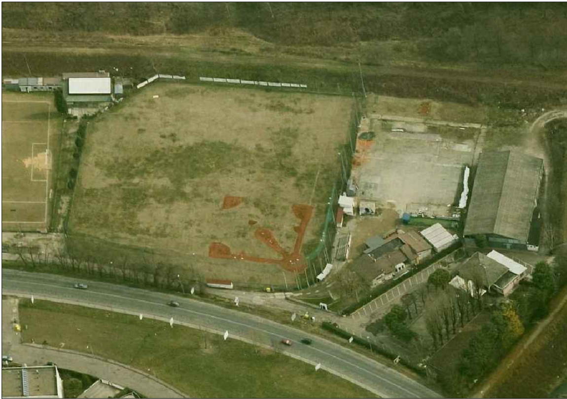
VISTA AEREA DA OVEST